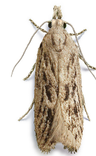
Anarsia lineatella Lepidoptera: Gelechiidae

Presenta normalmente tres generaciones al año, aunque puede haber una cuarta dependiendo de las condiciones climatológicas. Los primeros adultos comienzan a volar de marzo a mayo dependiendo de la zona. La segunda generación puede darse de junio a agosto y la tercera generación de agosto a octubre, pudiendo variar cada una de ellas según el clima.